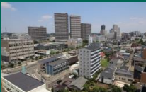
共用廊下から望む