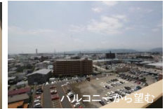
バルコニーから望む